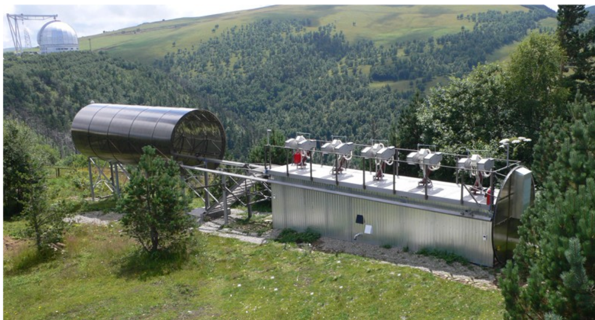
Рис. 3. Общий вид системы ММТ-9, установленной в САО РАН и работающей с июня 2014 года.

Система ММТ-9 была изготовлена в сотрудничестве с Казанским (Приволжским) Федеральным Университетом и ООО «Параллакс» и введена в эксплуатацию в июне 2014 года. Она расположена недалеко от 6-м телескопа БТА в САО РАН (см. Рисунок 3).